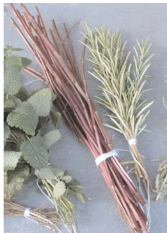
Die Natur bietet Hilfe: Thymian und Efeu bei Husten

Dieser Rat hat einen wahren Kern, übersieht aber, dass es sehr gut möglich ist, bestimmte Symptome einer Erkältung zu lindern und das Verschlimmern zu verhindern.