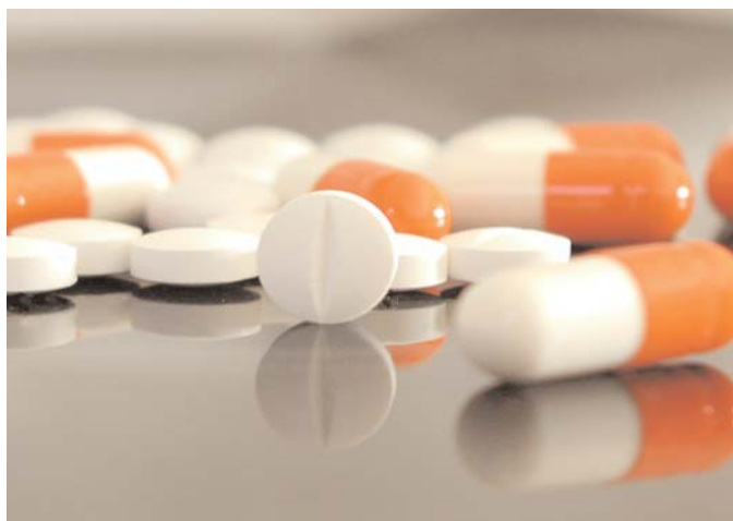
NSAR - Wegen lebensgefährlicher Nebenwirkungen heute sehr kritisch beurteilt

Wie häufig in der Medizin stehen dem behandelnden Arzt auch bei der Behandlung eines akuten Gichtanfalles mehrere Mittel und Methoden zur Verfügung. Nie zuvor war die Variabilität der Therapie von Krankheiten größer als heute und nie zuvor haben Patienten von dieser Variabilität